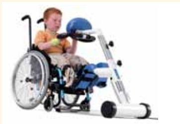
MOTOMed gracile (fyrir börn)

Með mótör og snjöllum hugbúnaði. Movement Therapy Systems fyrir fólk með lömum, spasma og minnkaðan vöðvastyrk.