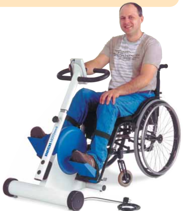
MOTMed viva 1 Með handfangi og stuðningi við kálfa (aukahlutur)

Regluleg hreyfing. Gera eitthvað fyrir sjálfan sig. Hvort tveggja hefur jákvæð áhrif á andlega vellíðan.