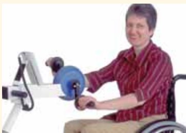
Handhjól MOTOMed viva 1