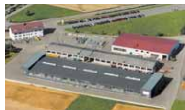
RECK-Technik GmbH & Co. KG, Betzenweiler, GERMANY