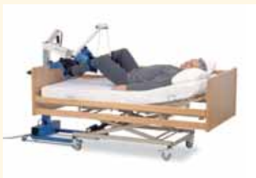
MOTOMed letto (fyrir rúmliggjandi)